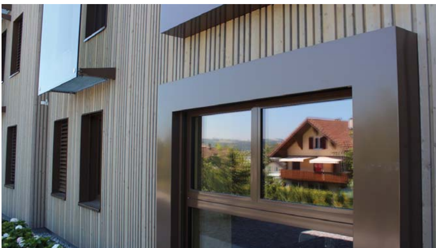
Foto oben: Das Objekt Chotten besticht mit einer gelungenen Kombination von Holz und Glas. Foto mitte: Die doppel­lagige Fassade ist enorm langlebig. Foto unten: Vorgehängte Glasplatten und eingerahmte Fenster unterstreichen das abwechslungsreiche Gesamtbild.